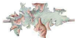
Narsaasivohelo Platymonia glauca • Nivolar