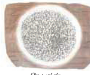
Piistojäkälä Glyphis sericea • Skägglar