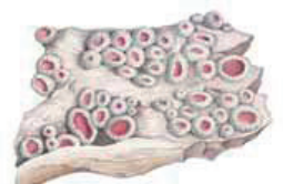
Punavahajäkälä Gyalecta alba • Almlar