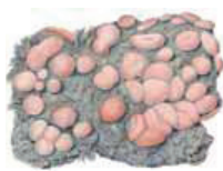
Tusvojäkälä Leucophaea ericetorum • Vitmolalar