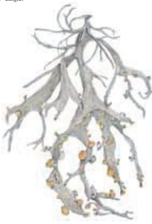
Isosustojäkälä Ramalina fraxinea • Brooklar