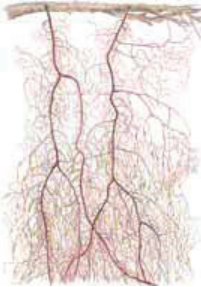
Tummalappo Byrrhia fuscescens • Mmlar