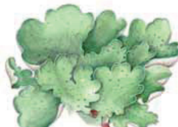
Pilkunohajäkälä Peltigera aphthosa • Toonlar