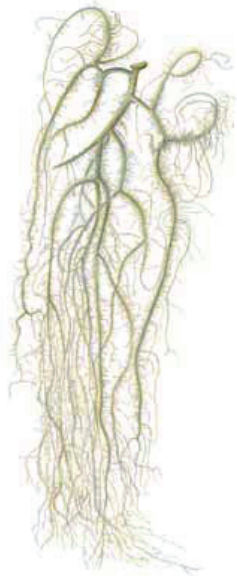
Rippunaava Usnea dasycarpa • Skägglar