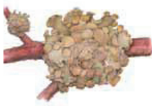
Pikkusivohelo Cetraria septentrionalis • Gårdgäddlar