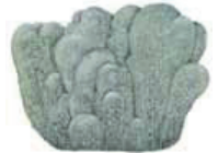
Pallesaporanjäkälä Cladonia stellaris • Finsterlar