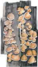
Kantosuonujäkälä Hypocomyces andracocephala • Kofflarlar