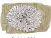
Valkoaakajäkälä Physcia apiculata • Roskullar