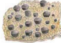
Narsaankajäkälä Cyphellium imputans • Sotlar