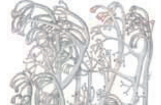
Narsaaporanjäkälä Cladonia rangiferina • Grö rindlar