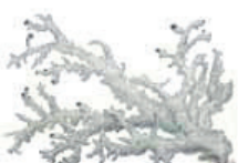
Suomutinjäkälä Stereocaulon saxatile • Klipp-pääksilär