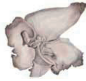
Narsaanaopajäkälä Umbliscaria hirsuta • Rogglar