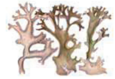
Isokivivoijäkälä Cetraria islandica • Islandlar