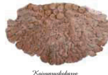
Kaisunusokakarve Melanohyalus uliginosa • Sotimäkkilär