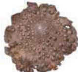
Kahmujäkälä Lanallia punctata • Toonlar