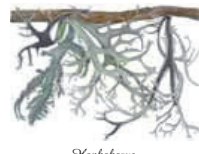
Nankakarve Pseudovernia perforans • Gillar