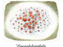
Narsaankajäkälä Leucania aliphana • Kockimmlar