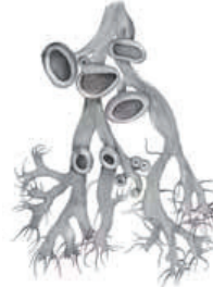
Puistovipsijäkälä Aspurgium cellaris • Allilär