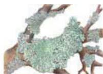
Sornipaisakarve Hypogymnia physodes • Blålar