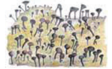
Vihersupijäkälä Calicium vire • Grön spällar