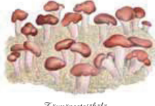
Tösmänastajäkälä Baeomyces rufus • Hillar