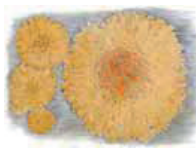
Narsaankajäkälä Xanthoria parietina • Kiggelär