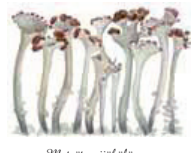
Metsätovijäkälä Cladonia gracilis subsp. arbuscula • Bögrastängellar