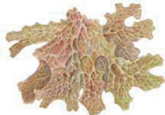
Raidankeskajäkälä Lobaria palmataria • Langlar