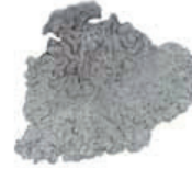
Kallioisakarve Parmelia saxatilis • Pönglär