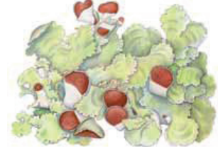
Pohjankehojäkälä Neptroma arcticum • Norrlandlar