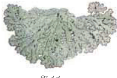
Reikakarve Menegazzia acrobata • Hillar