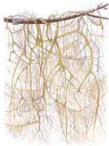
Kospitappo Alcortaria sarmentosa • Garmlar