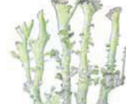
Taplatovijäkälä Cladonia phyllopora • Svartfälar