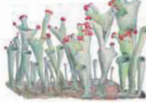
Suppilotovijäkälä Cladonia pleurota • Mjölig lochenhillar