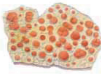
Keltakultajäkälä Caloglyphia flavorubescens • Aporongolat