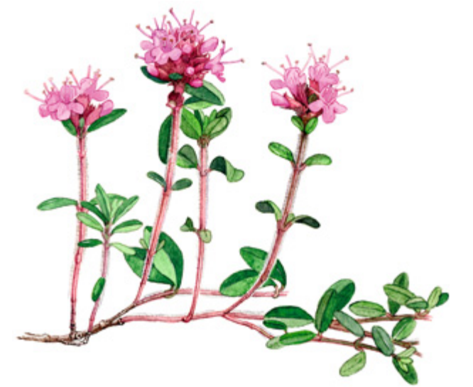
KANGASAJURUOHO Thymus serpyllum , backtimjan, Wild thyme