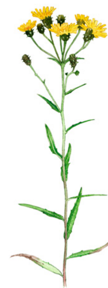
SARJAKELTANO Hieracium umbellata , fläckfibbla, Hawkweed