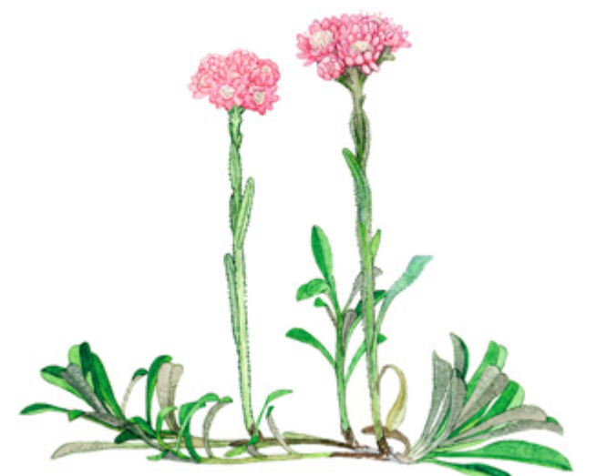
KISSANKÄPÄLÄ Antennaria dioica , kattot, Cat's foot