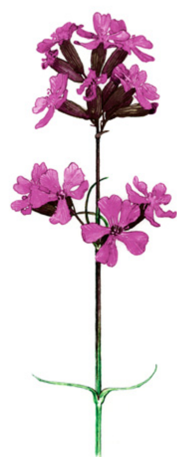
MÄKITERVAKKO Silene viscaria , tjårblomster, Sticky catchfly