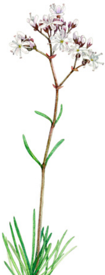
KANGASRAUNIKKI Gypsophila fastigiata , sääpört, Baby's breath