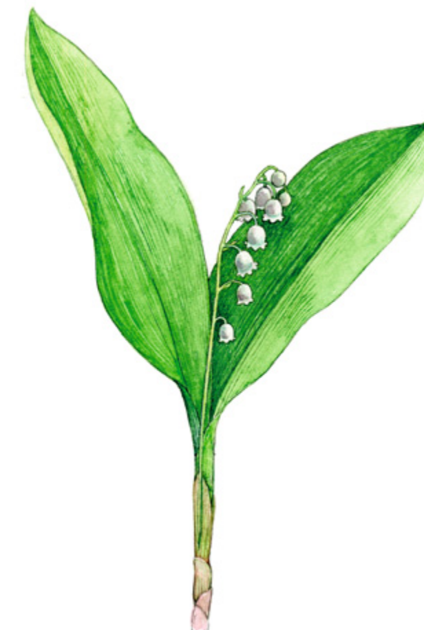
KIELO Convallaria majalis , liljekonvalj, Lily-of-the-valley