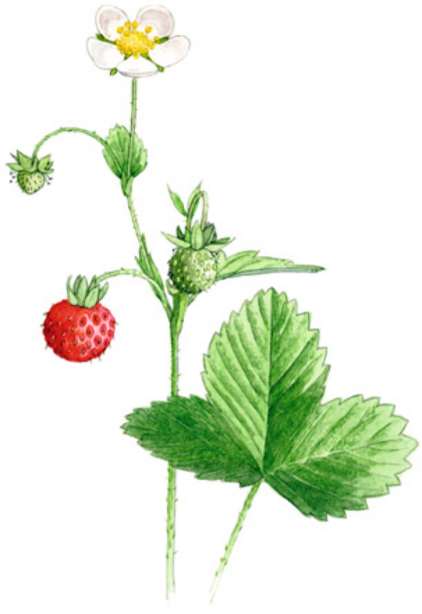
AHOMANSIKKA Fragaria vesca , smultron, Wild strawberry