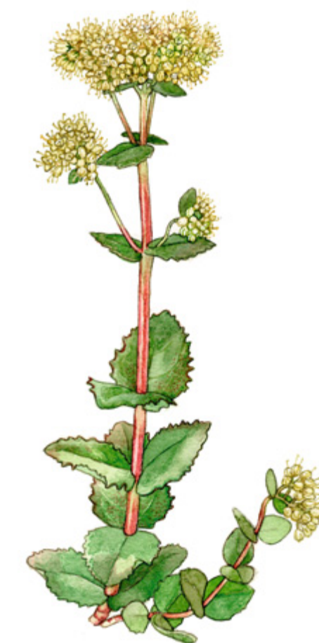
ISOMAKSARUOHO Hylotelephium telephium , kärleksört, Orpine