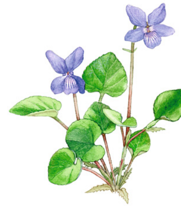
HIETAORVOKKI Viola rupestris , sandviol, Teesdale Violet