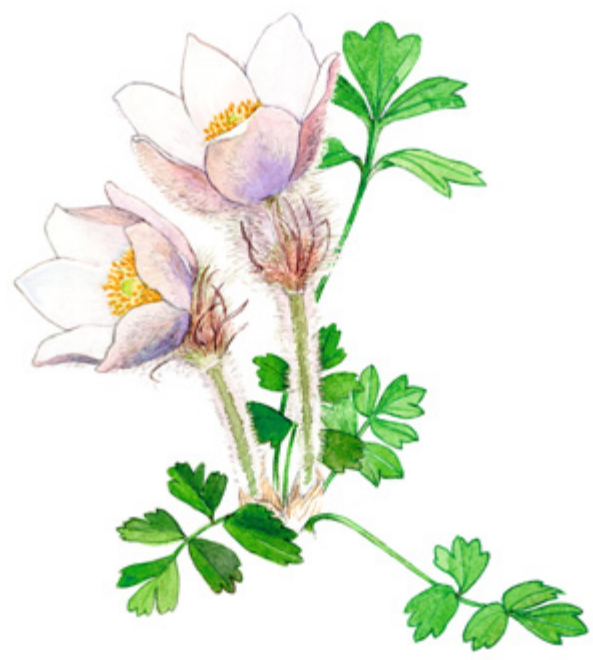
KANGASVUOKKO Pulsatilla vernalis , mosippa, Spring Pasqueflower