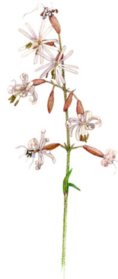
NUOKKUKOHOKKI Silene nutans , backglim, Nottingham catchfly