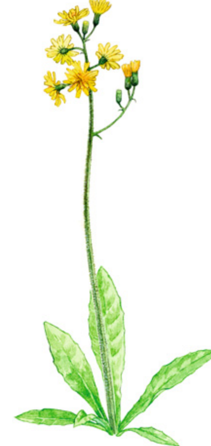
VANAKELTTO Crepis praemorsa , klasefibbla, Leafless Hawk's beard