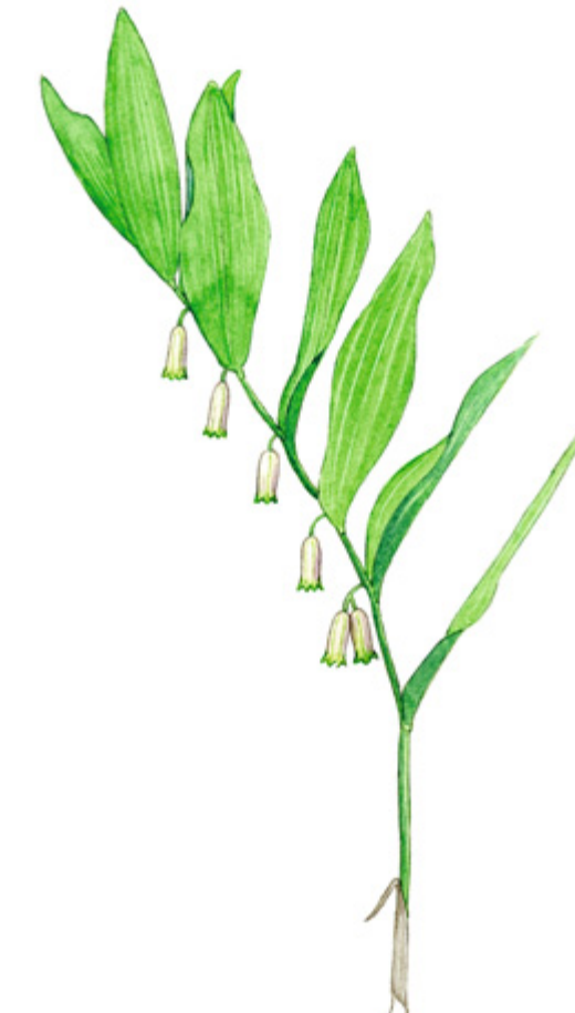
KALLIOKIELO Polygonatum odoratum , getrams, Angular Solomon's seal