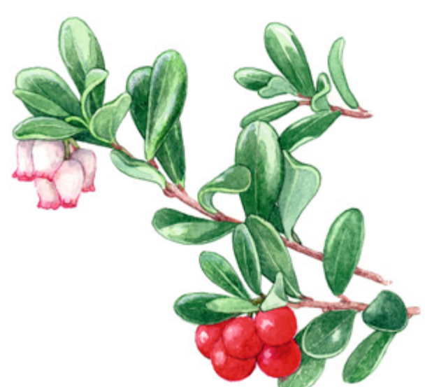
SIANPUOLUKKA Arctostaphylos uva-ursi , mjölan, Bearberry