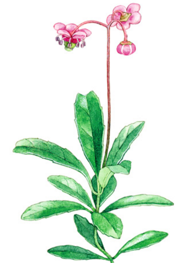
SARJATALVIKKI Chimaphila umbellata , ryl, Prince's Pine