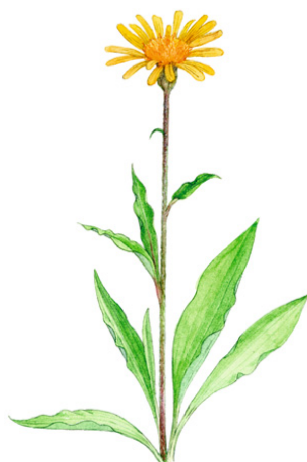
SIKOJUURI Scorzonera humilis , svinrot, Viper's grass