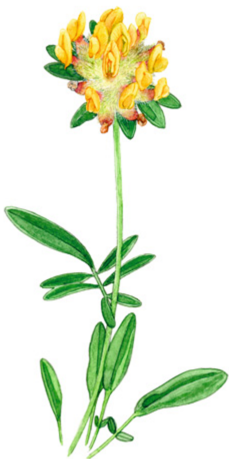
MASMALO Anthyllus vulneraria , getvåppling, Kidney Vetch