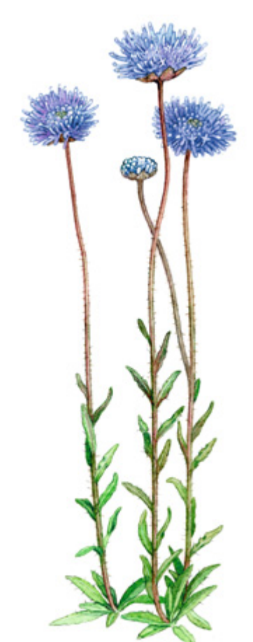
VUORIMUNKKI Jasione montana , blåmunkar, Sheep's bit scabious