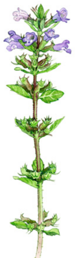
KETOKÄENMINTTU Satureja acinos , harmynta, Basil thyme