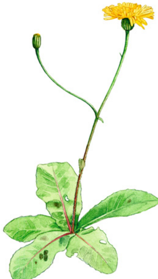
HÄRÄNSILMÄ Hypochaeris maculata , slätterfibbla, Spotted cat's ear