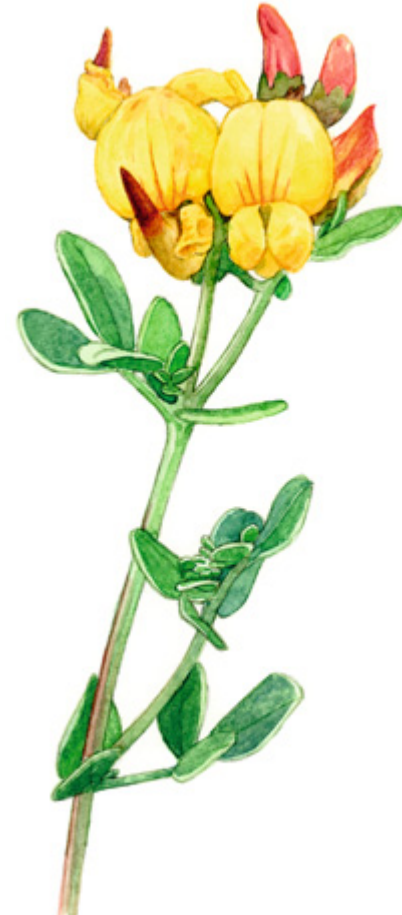
HARJUKELTAMAITE Lotus corniculatus var. arenosus , kärvingtand, Birdsfoot-trefoil