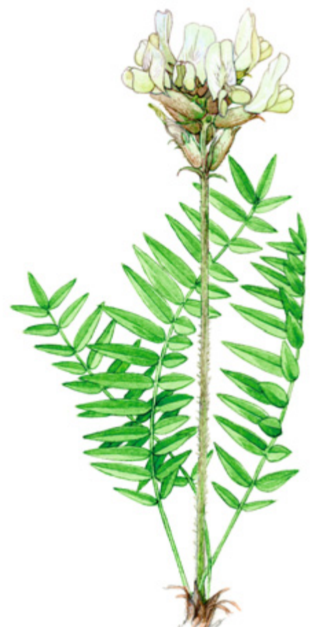
IDÄNKEULANKÄRKI Oxytropis campestris ssp. sardida , ryssvedel, Yellow beaked milk vetch