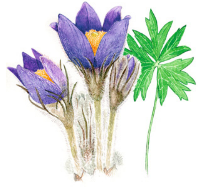
HÄMEENKYLÄMÄNKUKKA Pulsatilla patens , nipsippa, Eastern pasque flower