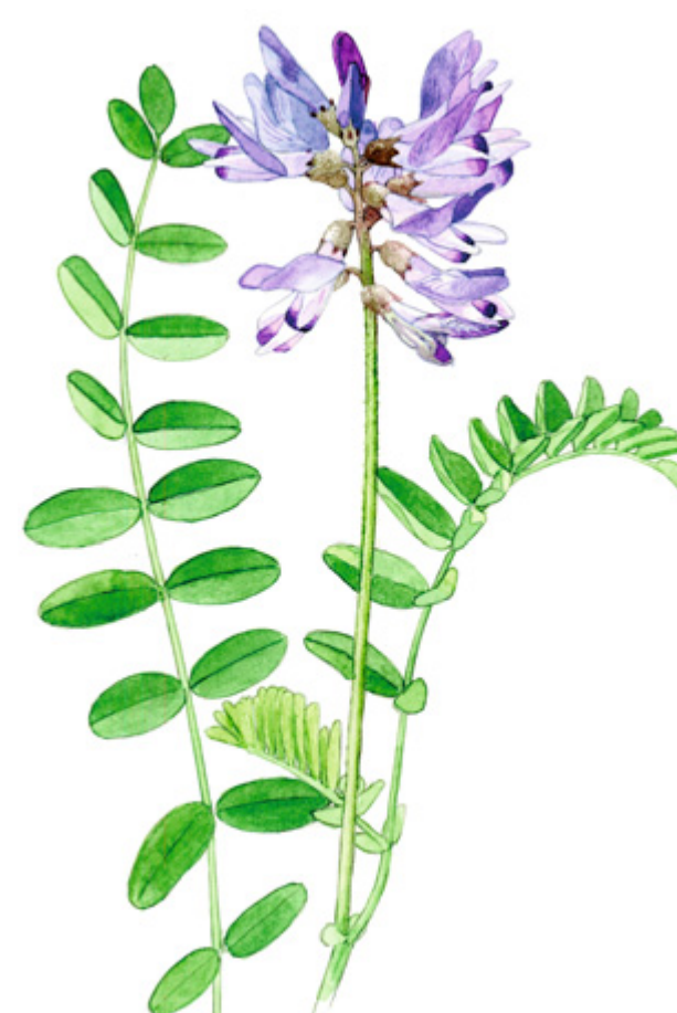
TUNTURIKURJENHERNE Astragalus alpinus , fjällvedel, Alpine Milkvetch